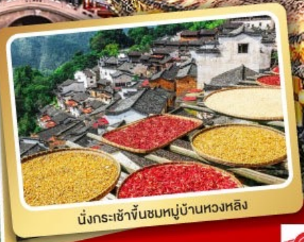
นั่งกระเช้าขึ้นชมหมู่บ้านหวงหลิง