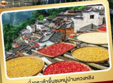
มังกร-เข้าจันทรมหาหลิงซา