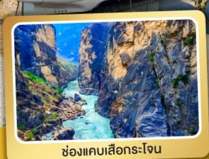
ช่องแคบเสื่อกระโจน

เมนูพิเศษ ! สุกี่ปลาเซลมอน สุกี่เห็ด อาหารกวางตุ้ง