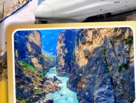
ช่องแคบเสื่อกระโจน

เมนูพิเศษ ! สุกี้ปลาแซลมอน สุกี้เห็ด อาหารกวางตุ้ง