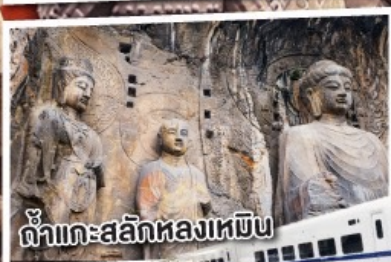
ถ้ำกะสลักหลงเหมิน