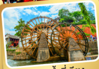
กังหันน้ำลี่เจียง