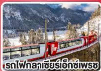
รถไฟกลาเซียร์เอ็กซ์เพรส