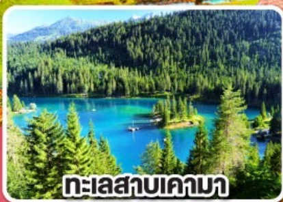
ทะเลสาบเคามา

เกาะดอกไม้ รถไฟธรรมชาติและมหาน้ำแข็ง สวิตเซอร์แลนด์ เยอรมนี 8 วัน 5 คืน