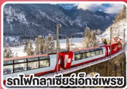
รถไฟกลาเซียร์เอ็กซ์เพรส