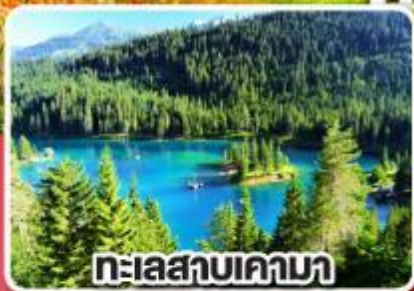
ทะเลสาบเคามา

เกาะดอกไม้ รถไฟธรรมชาติและมหาน้ำแข็ง สวิตเซอร์แลนด์ เยอรมนี 8 วัน 5 คืน