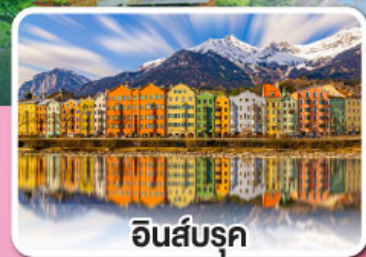
อินส์บรุค