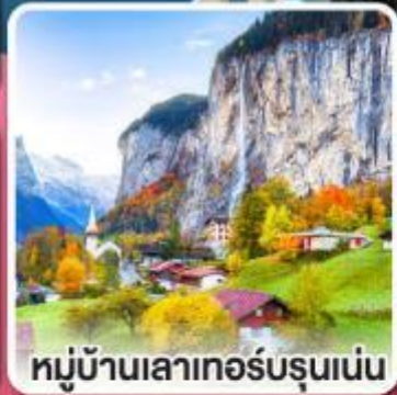
หมู่บ้านเลาเทอร์บรุนเนอร์