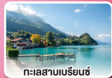
ทะเลสาบเบรียนซ์