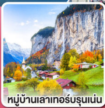
หมู่บ้านเลาเทอร์บรุนเนน