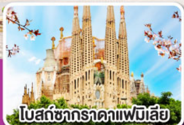
โบสถ์ซากกราดาแฟมิเลีย