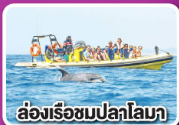
ล่องเรือชมปลาโลมา