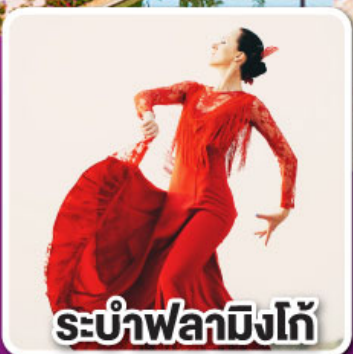
ระบำฟลามิงโก