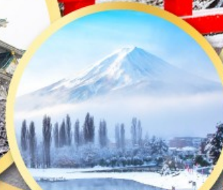
ทะเลสาบคาวากุจิโกะ