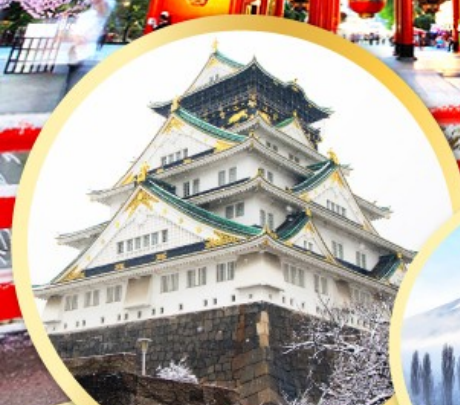
ปราสาทโอซาก้า