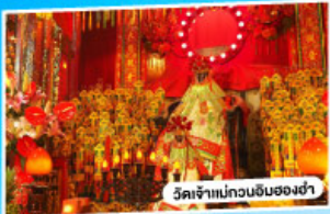
วัดเจ้าแม่กวนอิมของง่า

*นั่งรถข้ามสะพานเซ็นเจิ้น-จงซาน "สะพานข้ามทะเลที่สูงที่สุดในโลก"