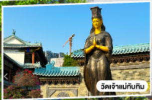
วัดเจ้าแม่กวนอิม