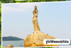
จูไห่พีซเซอร์กิส