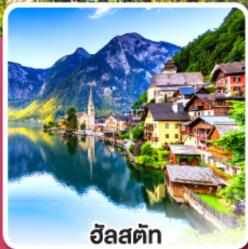
ฮัลสตัดท์

เที่ยวเก็บครบเส้นทาง สายโรแมนติก เยอรมัน จากเวิร์ชบวร์คสู่ฟูสเซน