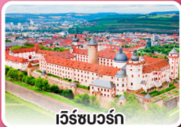
เวิร์ชบวร์ค