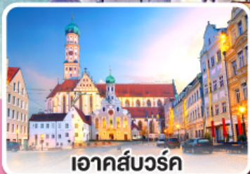
เอาคส์บวร์ค

ถนนสายนี้...โรแมนติกมาก เยอรมนี ออสเตรีย 8 วัน 5 คืน