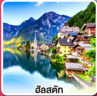
ฮัลสตัดท์

เที่ยวเก็บครบเส้นทาง สายโรแมนติก เยอรมัน จากเว็ชบวร์คสู่ฟูสเซน