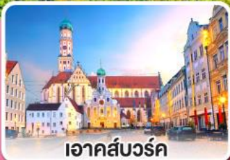
เอาคส์บวร์ค