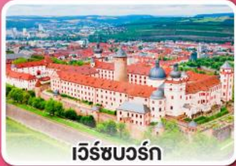
เว็ชบวร์ค