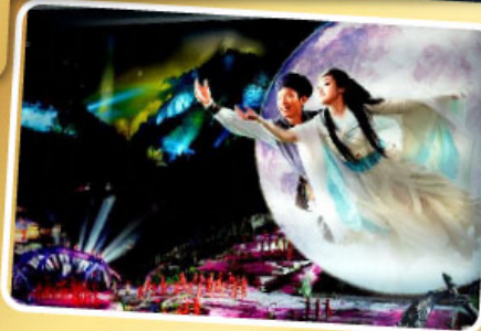
โชว์จิ้งจอกขาว

เที่ยวครบจบทุกไฮไลท์ เมืองอาณาจักรเจียเจีย