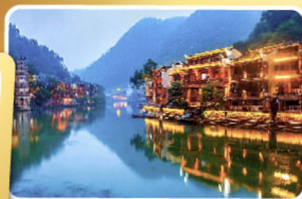
เมืองโบราณฟิ่งหวง