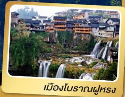
เมืองโบราณฝู่หลง

เที่ยวครบสูตร ฟู่หลง ฟิ่งหวง 6 วัน 5 คืน