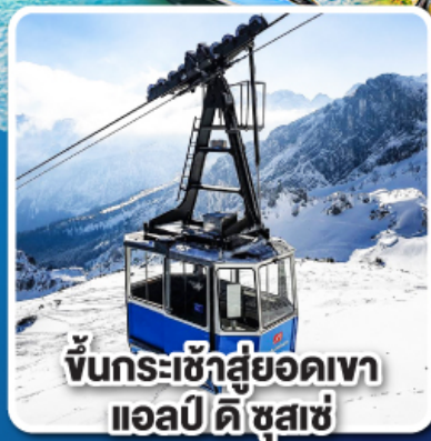
ขึ้นกระเช้าสู่ออดเขา แอลป์ ดิ ชุสแซ่

เที่ยวเมืองอินส์บรุค เพชรเม็ดงามสุดโรแมนติก แห่งแคว้นทิโรล ราคาเริ่มต้น