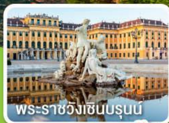
พระราชวังเซินบรุนน