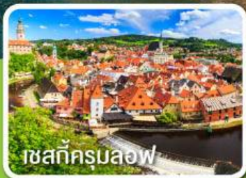
เชสท์ครุมลอฟ