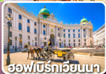
ฮอฟบวร์กเวียนนา