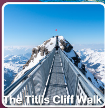
The Titlis Cliff Walk

ตามรอยซีรีส์ Crash Landing on you ที่ทะเลสาบเบรียนซ์