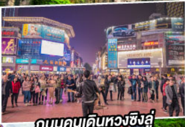
ถนนคนเดินหวงชิ่งอู่