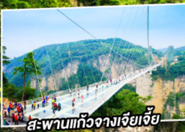
สะพานแกว่งฉางเจียเจีย