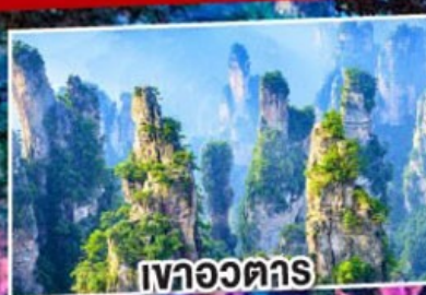
เวาอวตาร