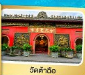
วัดต้าอ้อ