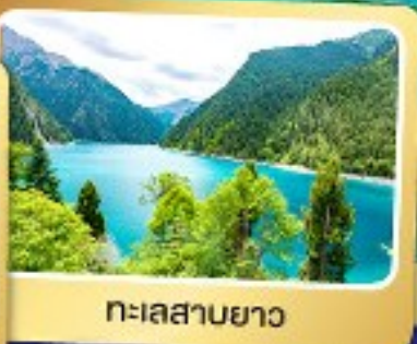
ทะเลสาบยาว