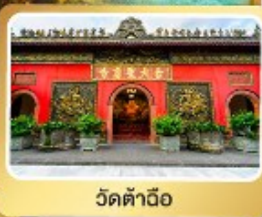
วัดต้าอื่อ