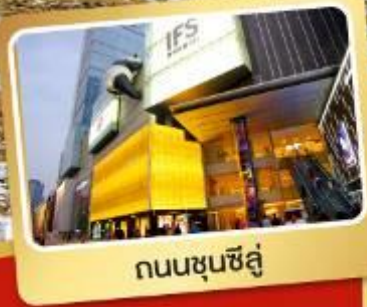
ถนนชุนชี่ลู่