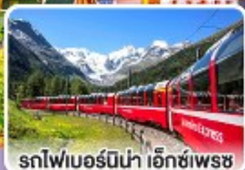
รถไฟเบอร์นีนา เอ็กซ์เพรส

รถไฟสายโรแมนติกและยอดเขาสุดพีคสุด อิตาลี สวิตเซอร์แลนด์ ออสเตรีย สโลวาเกีย 10 วัน 7 คืน