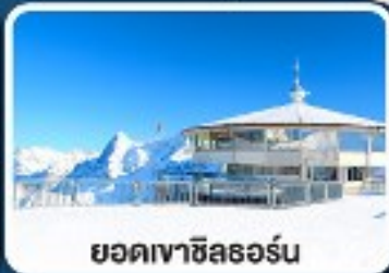
ยอดเขาซิลลอร์ด