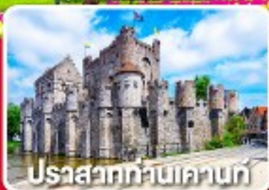
ปราสาทท่านเคานท์