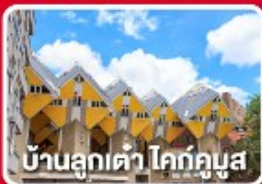
บ้านลูกเต่า โคก่กูมูส