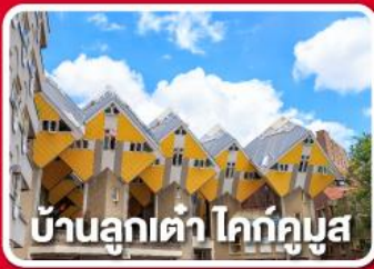
บ้านลูกเต๋า โคทคูบัส