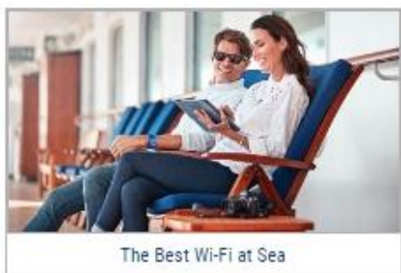
The Best Wi-Fi at Sea