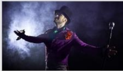
Featured Guest Entertainers