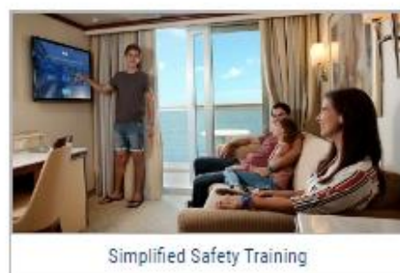
Simplified Safety Training