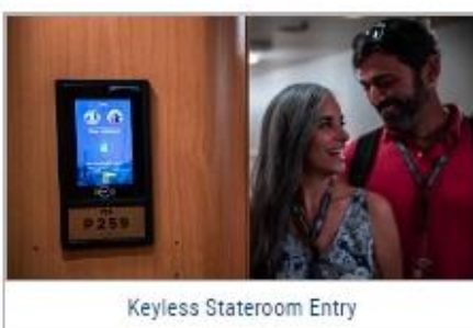
Keyless Stateroom Entry