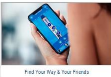
Find Your Way & Your Friends