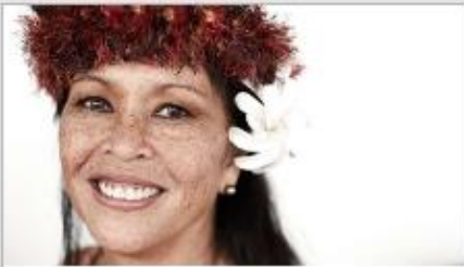
Festivals of the World