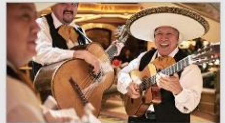
Music & Dancing