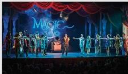
Original Musical Productions