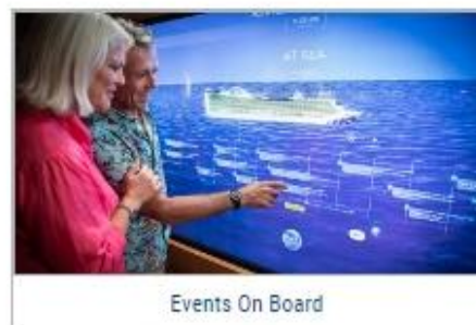
Events On Board