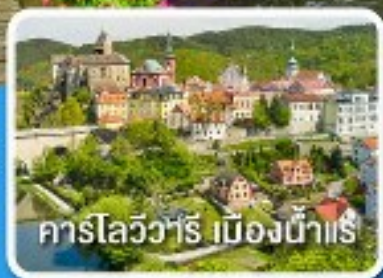
คาร์โลวารี เมืองน้ำแร่

เยอรมนี เชก สโลวัก ฮังการี ออสเตรีย 8 วัน 5 คืน