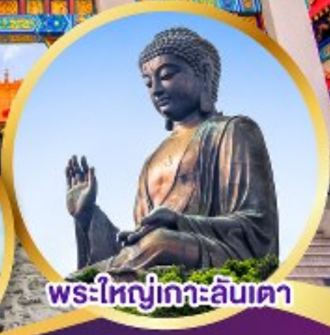
พระใหญ่เกาะลันเตา