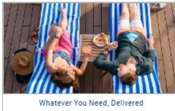
Whatever You Need, Delivered