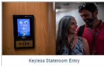
Keyless Stateroom Entry