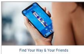
Find Your Way & Your Friends