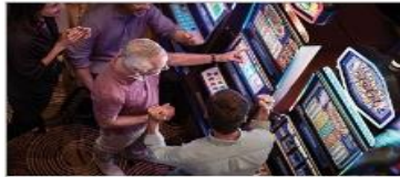
Vegas Style Casino