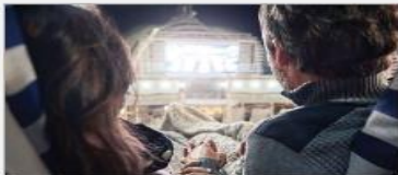
Movies Under the Stars®

On every Princess ship, you'll find so many ways to play, day or night. Explore The Shops of Princess, celebrate cultures at our Festivals of the World or learn a new talent – our onboard activities will keep you engaged every moment of your cruise vacation. 1