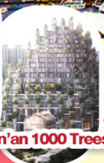
Tian'an 1000 Trees