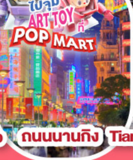
ถนนนานกิง