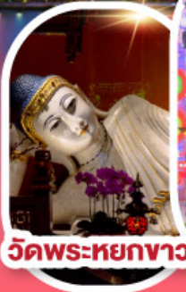
วัดพระหยกขาว