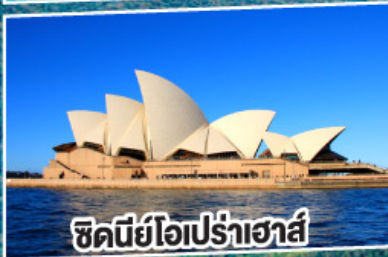
ซิดนีย์โอเปร่าเฮาส์