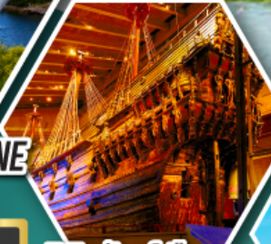
พิพิธภัณฑ์เรืออาซา