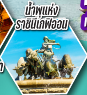
น้ำพุแห่ง ราชินีเดฟวอน

ค้างคืนบนเรือสำราญ 2 ลำ เรือสำราญ TALLINK SILJA LINE และ เรือสำราญ DFDS