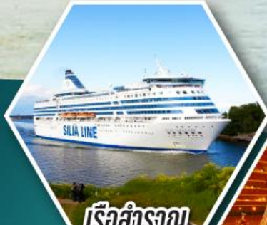
เรือสำราญ TALLINK SILJA LINE