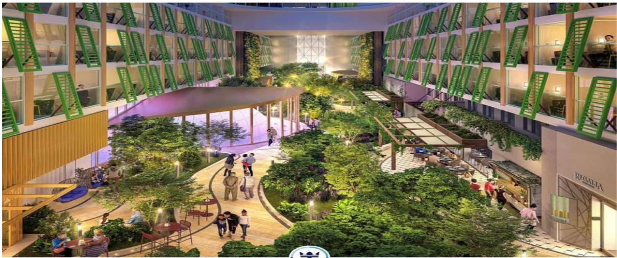
CENTRAL PARK DECK 8

ร้านอาหารที่ท่านสามารถเลือกรับประทานได้ทั้งรมื้ออาหาร