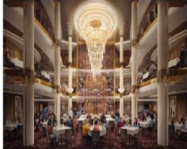
MAIN DINING ROOM

Royal Caribbean offers a myriad of casual dining options and quick bites for meals on the run.