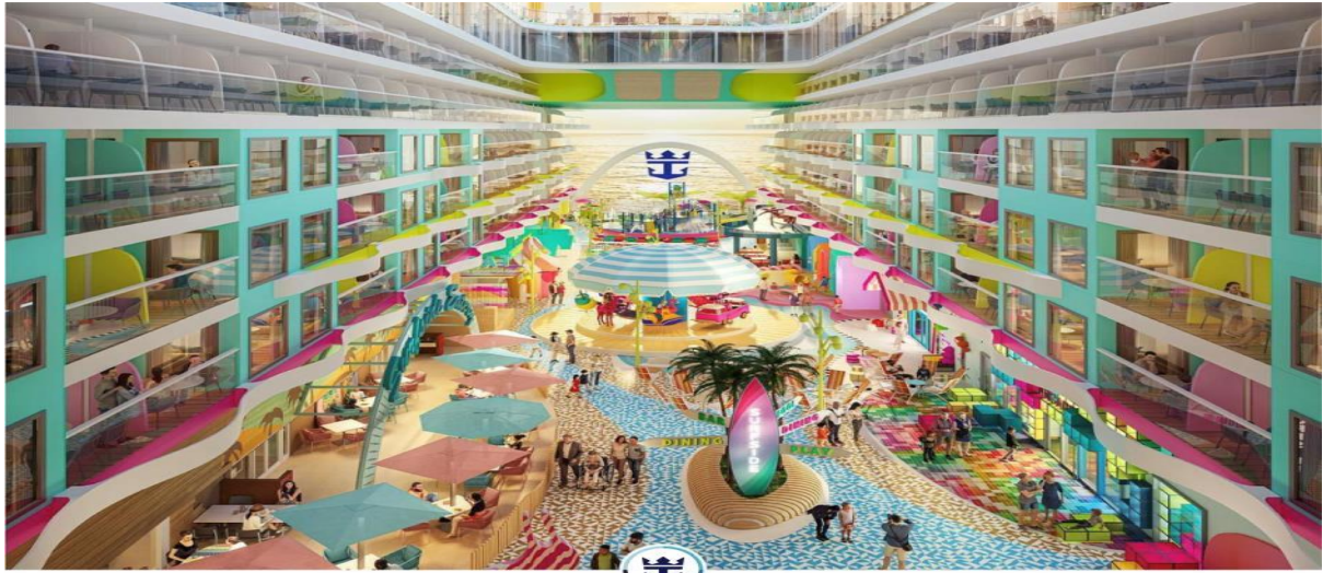
SURFSIDE DECK 7

หรือจะเดินเล่นช้อปปิ้งซื้อสินค้าตัวดีฟรีแถมตั้งชั้นนำที่ขึ้นไปไว้บนเรือมากมาย รับประทานอาหารจากหลากหลายสไตล์ตามร้านอาหารที่มีอยู่มากมายบนเรือสำราญ