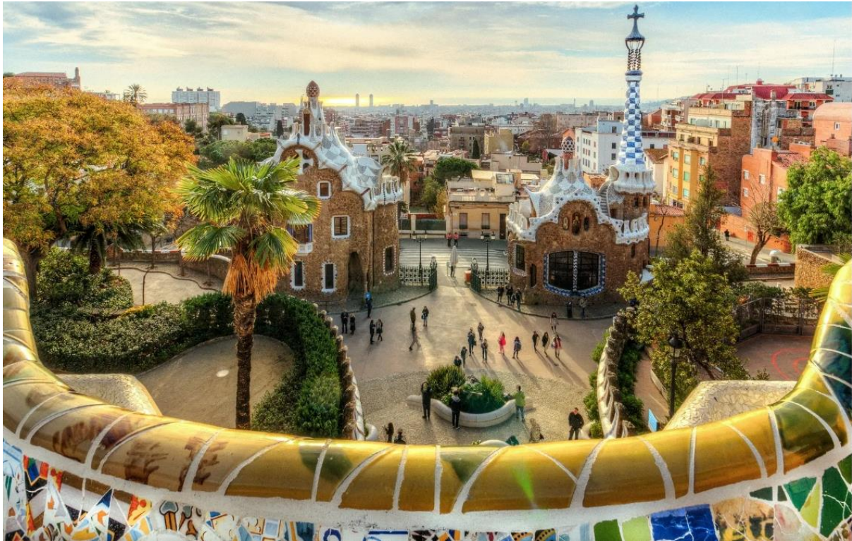
เข็คอินที่ท่าเรือ Barcelona , Spain