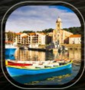
France Port Vendres