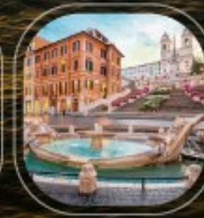
Italy Civitavecchia (Rome)

ราคาต่อคน : 175,900 บาท (รวมค่าเรือ, ค่าที่พัก, ค่าอาหารเช้า, ค่าเครื่องดื่ม, ค่าประกัน, ค่าภาษี) | ราคาใบเรือ : ค่าค่าตัว, ค่าค่าธรรมเนียม, ค่าธรรมเนียม, ค่าภาษี