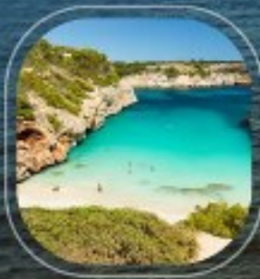
Spain Palma De Mallorca