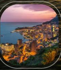
Monaco Monte Carlo