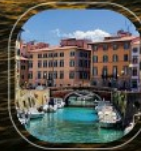
Italy Livorno (Tuscany)