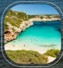
Spain Palma De Mallorca