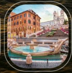
Italy Civitavecchia (Rome)

ราคารวม : ค่าทำเรือ, ค่าพนักงาน, อาหารทุกมื้อบนเรือสำราญ | ราคาไม่รวม : ค่าทำวีซ่า, ค่าเครื่องเงิน, ทอร์บนั่ง, อาหารพิเศษ