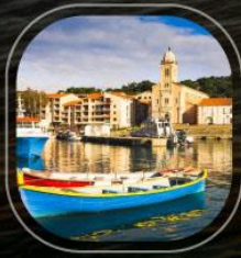
France Port Vendres