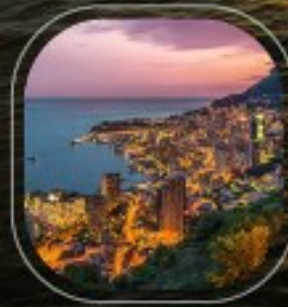
Monaco Monte Carlo