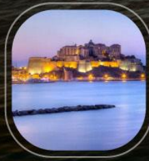
France Calvi (Corsica)