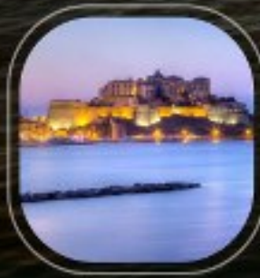
France Calvi (Corsica)