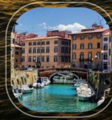
Italy Livorno (Tuscany)