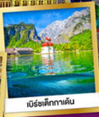
เบียร์ชเต็ทกาเดิน