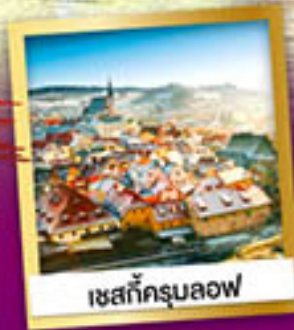
เซสท์ครุมลอฟ