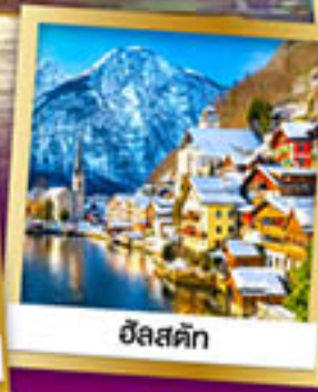
ฮิลส์ตัท