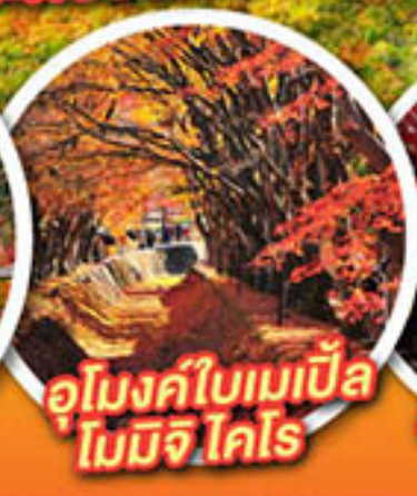
อุโมงค์ใบเมเปิ้ล โมมิจิ โคโร