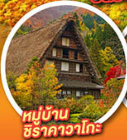
หมู่บ้าน ชิราคาวาโกะ