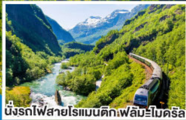
นั่งรถไฟสายโรแมนติกเฟลัมโบโคร์