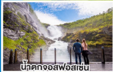
น้ำตกจอสฟอสเซ่น