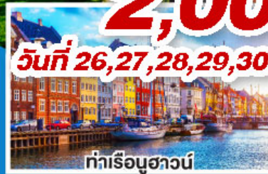
ท่าเรือฮาวน์

ล่องเรือสำราญสุดหรู DFDS พร้อมห้องพักแบบ Sea View