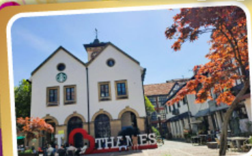
เทมส์ทาวน์