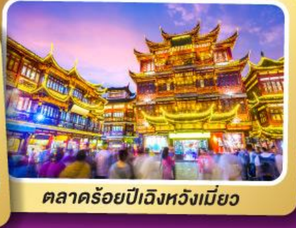
ตลาดร้อยปีฉางหวงเหมียว

สนุกสุดมันส์ไปกับเครื่องเล่น Shanghai Disneyland เต็มวัน