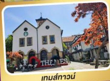
เทมส์ทาวน์