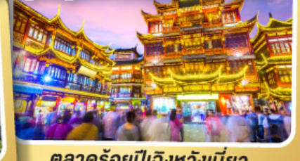
ตลาดร้อยปีเจียงหวงเมี่ยว