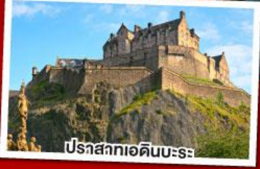
ปราสาทเอดิเนบะระ