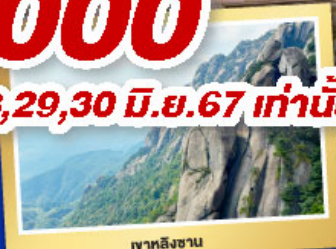
เทาลิ่งซาน