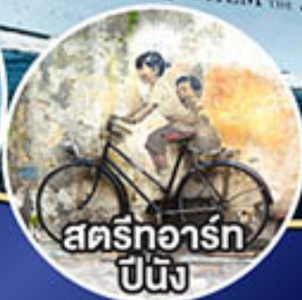
สตรีทอาร์ต ปีนัง