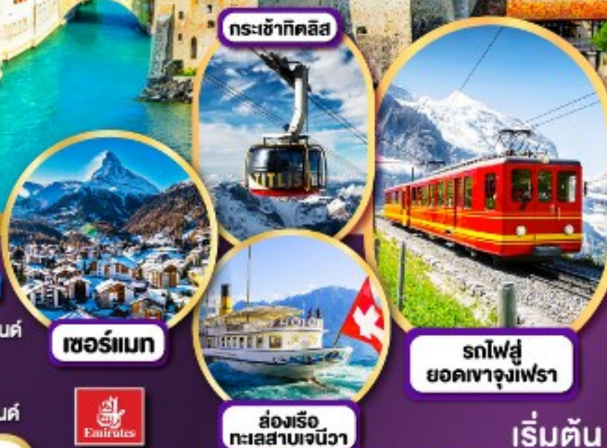
กระเช้ากิตลิส