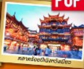
ศาลาร้อยปีชิงหวงเฉียว