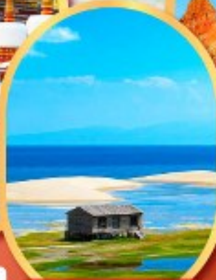
ทะเลสาบชิงไห่