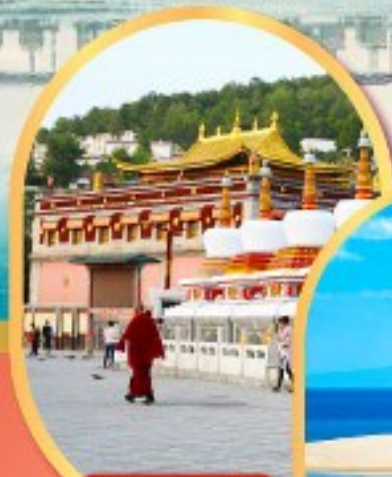
วัดต้าอ๋อ