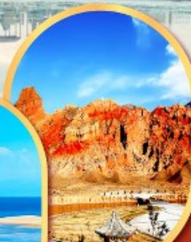
หุบเขาห้าสี อุทยานธรณีกุยเต๋อ