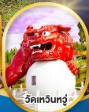
วัดเหวินทู่