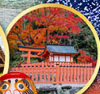
วัดคารุมะ