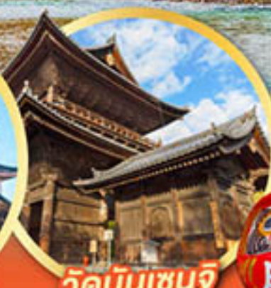
วัดนินเซินจิ