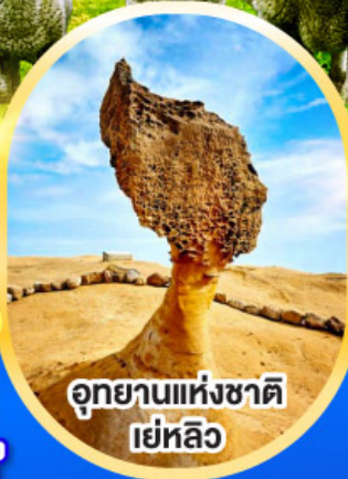
อุทยานแห่งชาติ เยหลิว