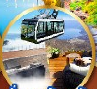
นังกระเช้าอุซซัง

สนุกกับกิจกรรมเก็บผลไม้ตามฤดูกาล นังกระเช้า Mt.Usu Ropeway (รวมค่ากระเช้า)