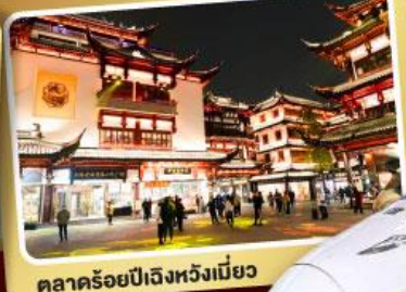
ตลาดร้อยปีเจิ้งหวิงเมี่ยว