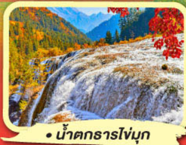
• น้ำตกธารไถ่บุก