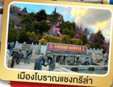
เมืองโบราณแซงกรี่ล่า