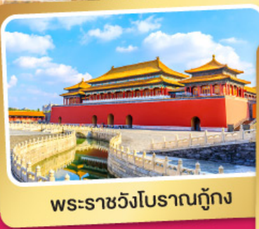
พระราชวังโบราณปักกิ่ง